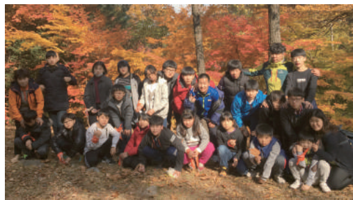
봄소풍(5월, 네이처파크), 가을소풍(10월, 앞산 '숲' 체험)