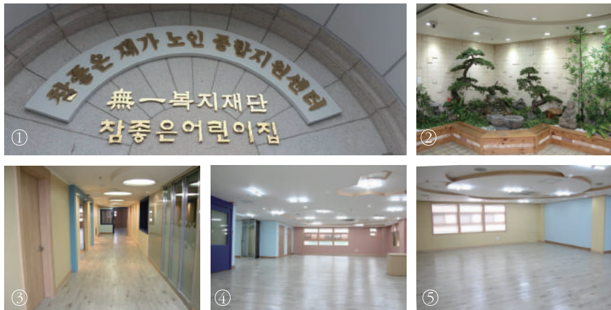
① 참좋은 재가노인종합지원센터 입구 ②③ 전경 ④⑤ 아늑하고 쾌적한 실내 공간