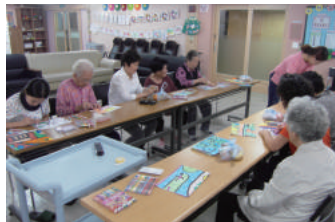
물감놀이 · 협동화