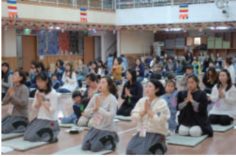
템플스테이 - 예불