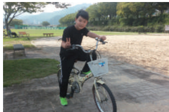
스트레스는 자전거와 함께 신천에서 신나게 운동하는 연결이의 모습