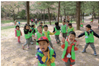
숲 · 생태 프로젝트 - 앞산 산책, 딸기밭 체험