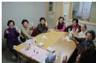
생활용품 만들기 어르신들께서 직접 천연샴푸를 만들고, 미용 및 건강상식을 공유함