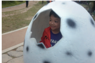
앞산 고산골 공룡공원 - 공룡알에서 나왔나 봐요.