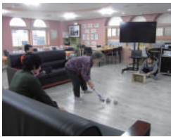
신문지 게이트 볼