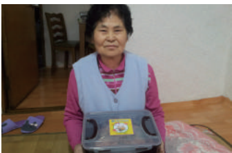
김장김치 지원(12월) 한국불교대학 대관음사 신도분들과 연계한 “사랑의 김장나누기” 행사를 통해 남구 소재 재가어르신 각 가정에 김치 지원해드립니다(140가구)