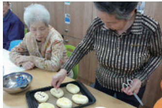
홈베이커리 · 이마트 협력 사업