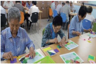
칠교 · 도형놀이

2016년 7월부터 기억 학교 협회에서 채택한 도형(칠교) 놀이교실, 한자교실, 그림일기 쓰기 총 3과목을 정규과목을 실시하게 되었습니다. 어르신들의 더 나은 일상생활 개선 및 인지 기능 향상을 위해 노력하겠습니다.