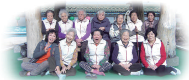
♡ 참좋은주간보호센터 어르신들의 행복한 모습 ♡