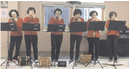
오카리나 공연 (맑은 소리)