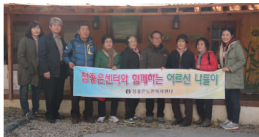
2016. 11. 23 상인 문화마을 도자기체험 및 외식 도자기 초급과정으로 흙을 직접 빚어 머그컵이나 접시를 만들