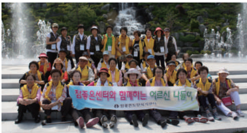
2016. 05. 27 봄 나들이 경북 산청 구형왕릉 및 동의보감촌 (남구 여성예비군 봉사자 동행)