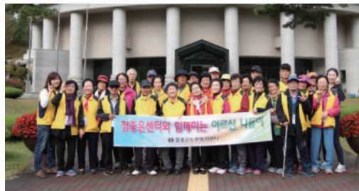
2016. 10. 25 가을 나들이 문경새재도립공원 및 석탄박물관 (남구 여성예비군 봉사자 동행)