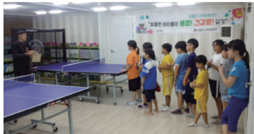
탁구교실(연 48회) - CJ 도너스캠프