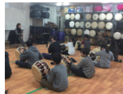
야간보호사업 사물놀이 수업 (연 48회, 연 2회 공연) - 대구 사회복지공동모금회 지원