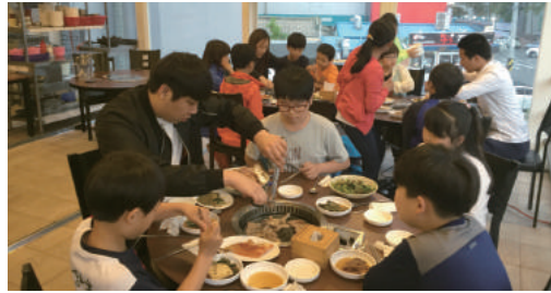
외식나들이(5월, 12월) 무량수전 노인전문 요양원, 상조서비스에서 지원