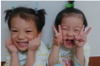
이렇게 귀여운 우리 일호와 일련이는 어디서 왔을까요?