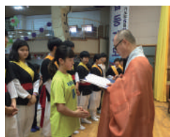
좋은인연장학회 장학금전달식 (5월)

지역 네트워크를 통해 아동을 지역 전문기관과 연계하여 통합 관리하고 후원자 개발, 자원봉사자 모집 및 관리