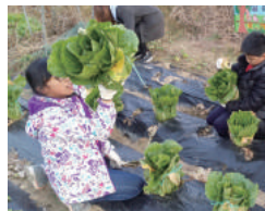
가창 대일리 참좋은 농장 체험 (연 24회)