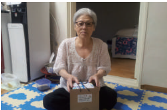
어르신 생신지원 매월 대상 어르신 댁에 방문하여 생신 축하와 선물 지원