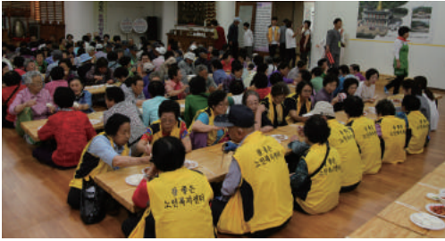
경로잔치(5월) 5월 가정의 달을 맞아 법인에서 주최하는 경로잔치에 참석. 각종 공연을 관람하고 점심식사 드심.