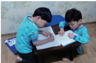
올해 유치원 가는 일호, 일련이 열심히 공부해요. 미래의 박사님들