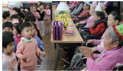
무량수전 어른신 생일잔치 축하공연