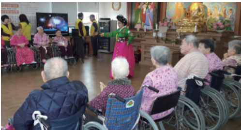
음악공연 (아름다운 동행)

아름다운동행봉사단, 손마사지봉사단, 이미용봉사단이 어르신들을 위해 방문 해주십니다.