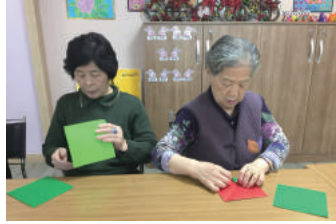
색종이 접기 · 퍼즐 맞추기