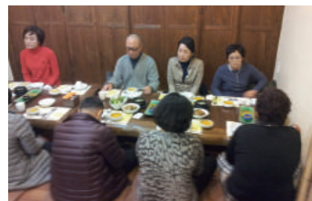
자원봉사자 간담회(12월) 한해 동안의 봉사활동에 감사의 말씀을 드리고 고충사항 및 소감을 공유함