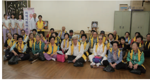
연세안과 원장님 외 의료진들의 무료 안과 진료 어르신들의 안질환을 발견, 치료 및 예방하도록 함.