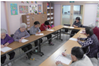
한글, 숫자, 한자, 외국어 교실