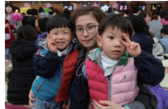
참좋은 어린이집 5세반 입학식 귀염둥이들 파이팅!