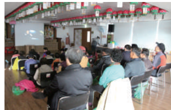
문화체험(영화감상) 매월 문화생활을 하기 어려운 어르신들을 모셔 영화감상