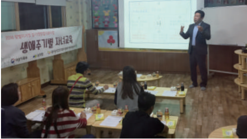
부모교육 연 2회 - 5월, 12월