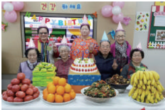
생신잔치 · 명절 선물 지원