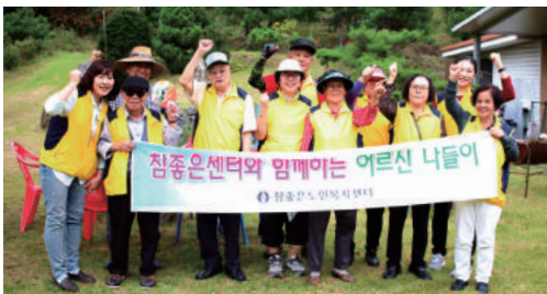
2016. 09. 28 소규모 나들이 경산 가나골 친환경체험농장에서 산머루따기, 투호 체험