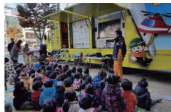
지역 사회 연계 - 한영 아동병원 체험, 중부 경찰서 방문, 중부소방서 이동안전체험차량 안전교육