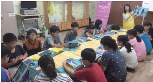
독서 프로그램(연 26회) - 대봉 도서관 지원