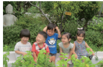
하늘법당 - 생태공원