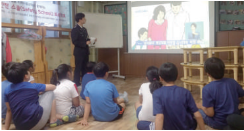
5대 의무교육(연 22회) - 성폭력 및 아동학대, 실종·유괴, 약물 오남용, 재난대비, 교통안전

아동이 안전한 곳에서 건강한 생활을 할 수 있도록 급식, 일상생활지원, 정서 지원, 안전지도 프로그램