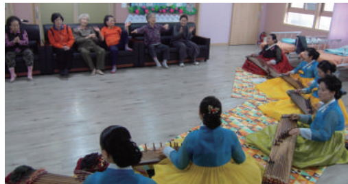
가야금 공연 (가향)