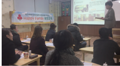
학부모간담회 (연 1회 - 12월)