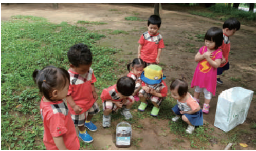
장수풍뎡이 방생 (앞산)