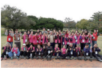
봄 · 가을 나들이