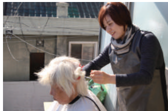
이미용 서비스 매월 전문 미용봉사자가 어르신 댁에 방문하여 커트, 염색 등의 서비스를 지원