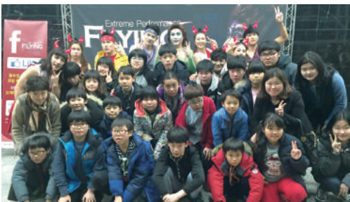
뮤지컬 플라잉 관람 (3월) - 지역아동센터 대구지원단 지원